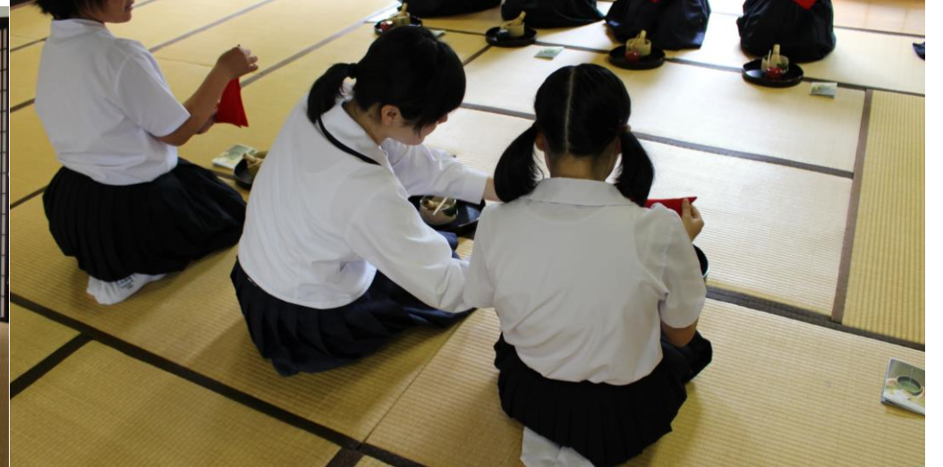
↑ 茶道の体験風景です。