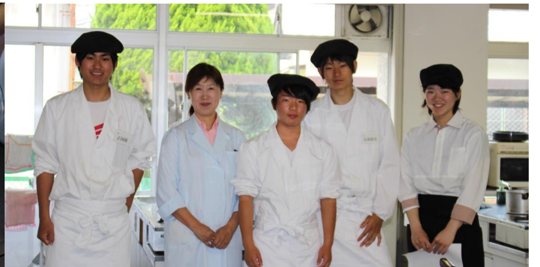
調理では、わらび餅をつくりました。調理コースの3年生がお手伝いさせていただきました。↑