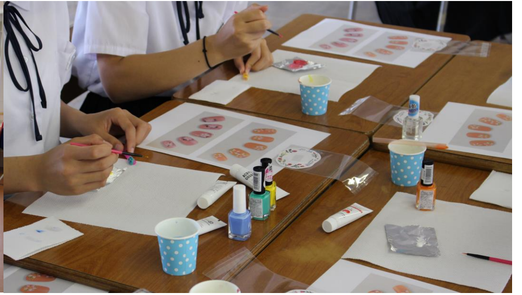
↑ 美容コースの体験授業では、カットとネイルを体験しました。